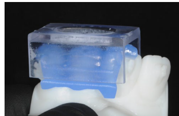
クリアインデックスシステム